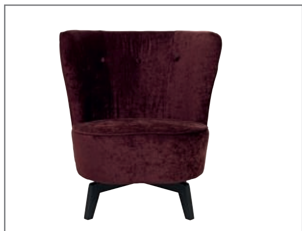
Carmen, wersja obrotowa