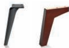
Carmen Brushed Black Chrome drewniana Carmen