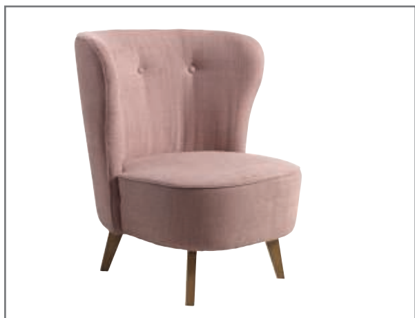
Carmen; wersja podstawowa; nóżki drewniane CARMEN

Fotel typu Carmen, to fotel-kameleon, można by rzec. Wszystko za sprawą tapicerki, która w zależności od barwy i struktury, zgrabnie dostosowuje się do charakteru otoczenia. Kształt fotela z kolei, odznaczający się miękką, łagodną w zagięciach linią, skutecznie zachęci do zatopienia się w nim i odpłynięcia w krainę błogiego relaksu.